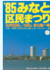
第4回ポスター 1985(昭和60)年