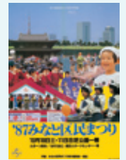
第6回ポスター 1987(昭和62)年