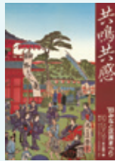
第2回ポスター 1983(昭和58)年