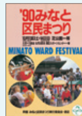
第9回ポスター 1990(平成2)年