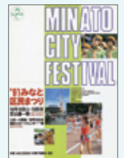
第10回ポスター 1991(平成3)年