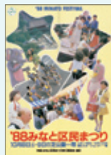
まぼろしの第7回ポスター 1988(昭和63)年