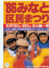
第5回ポスター 1986(昭和61)年