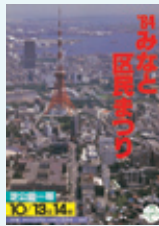
第3回ポスター 1984(昭和59)年