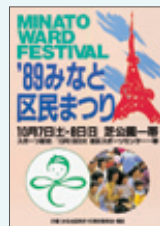
第8回ポスター 1989(平成1)年